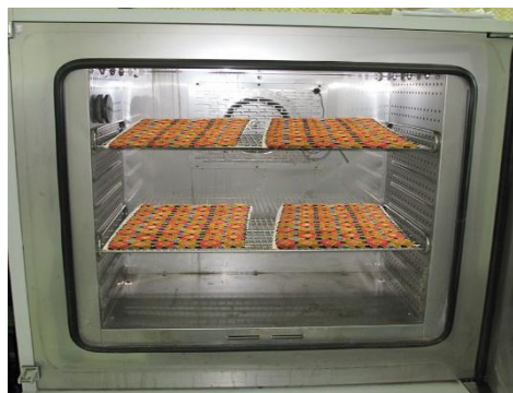
شکل ۱ - قرارگیری نمونه‌ها در رطوبت نسبی ۸۰ درصد در دستگاه Binder