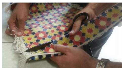
شکل ۲ - بریدن نمونه‌ها برای انجام آزمون

روش آزمون به این صورت است که نمونه‌ها را در دمای استاندارد ۲۰ درجه سلسیوس، بدون نور، بدون آلاینده‌های جوی با رطوبت نسبی ۸۰ درصد در دستگاه Binder مدل MKF 240 ساخت کشور آلمان در پژوهشگاه استاندارد ایران تنظیم و نمونه‌ها به مدت ۳۰ روز تحت این شرایط، مورد آزمون قرار گرفته است (شکل ۱).