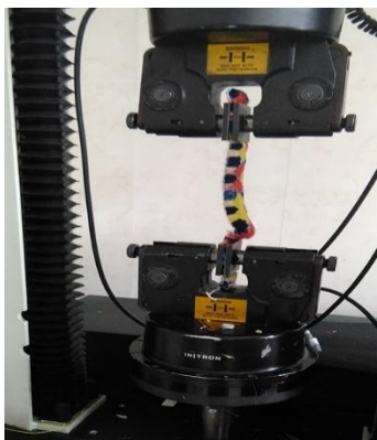
شکل ۳ - دستگاه مقاومت‌سنج