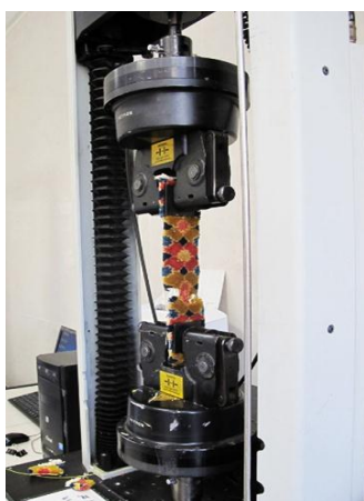
شکل ۴ - استحکام کششی بر روی نمونه‌ها