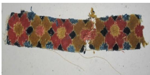
شکل ۵ - نمونه پس از آزمون

روش آزمون به این صورت است که نخست نمونه را به اندازه 5 \times 30 سانتی‌متر در راستای طول و عرض قالی برش زده و سپس در پژوهشگاه استاندارد ایران با استفاده از دستگاه مقاومت‌سنج از نوع CRE (از یازده طول دادن با سرعت ثابت) ساخت شرکت اینسترون (Instron) کشور انگلستان این آزمون انجام شده است، شایان ذکر است که هر آزمون طبق استاندارد ۵ مرتبه انجام شده، به این صورت که نمونه‌های برش خورده را در بین دو فک دستگاه قرار داده و با سرعت ۱۰۰ میلی‌متر بر دقیقه کشش انجام شده است. با توجه به این که اندازه نمونه‌ها 5 \times 30 سانتی‌متر می‌باشد از هر طرف